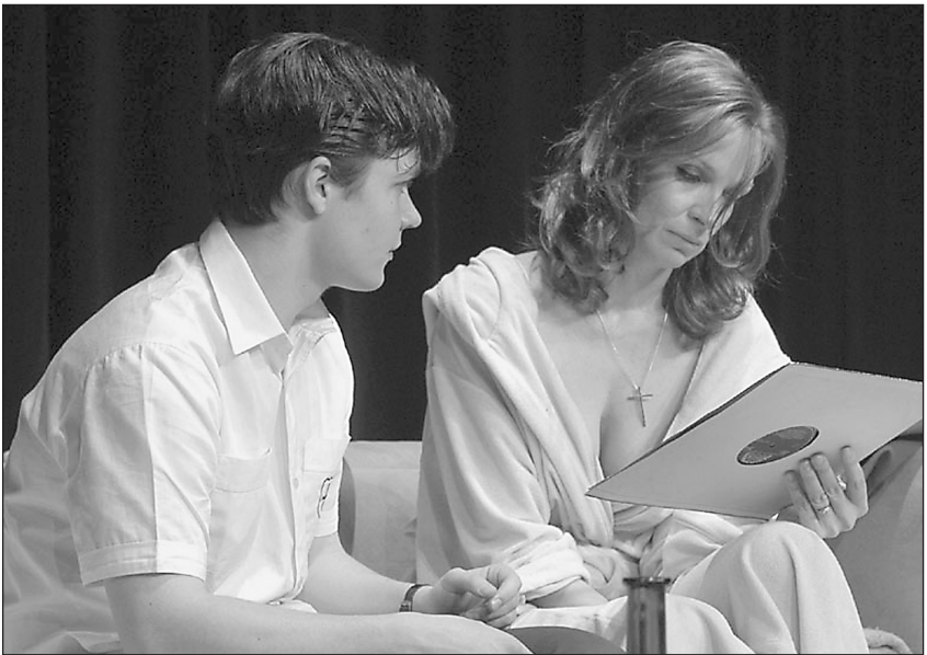
Madame Melville je nejnovější inscenací pražského Studia DVA.

V nadcházející divadelní sezóně, která končí v červnu příštího roku, je pro abonenty divadla připraveno celkem pětadvacet titulů nejrůznějších žánrů. -eze-